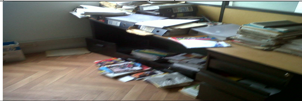
Documentos abandonados algunos en el piso sin ninguna organización y seguridad

El artículo 6º de la Ley 610 de 2000 relacionado con el Daño Patrimonial al Estado señala que: “Para efectos de esta ley se entiende por daño patrimonial al Estado la lesión del patrimonio público, representada en el menoscabo, disminución, perjuicio, detrimento, pérdida, uso indebido o deterioro de los bienes o recursos públicos , o a los intereses patrimoniales del Estado, producida por una gestión fiscal antieconómica, ineficaz, ineficiente, inequitativa e inoportuna, que en términos generales, no se aplique al cumplimiento de los cometidos y de los fines esenciales del Estado, particularizados por el objetivo funcional y organizacional, programa o proyecto de los sujetos de vigilancia y control de las contralorías. Dicho daño podrá ocasionarse por acción u omisión de los servidores públicos o por la persona natural o jurídica de derecho privado, que en forma dolosa o culposa produzcan directamente o contribuyan al detrimento al patrimonio público. Subrayado y resaltado fuera del texto.”