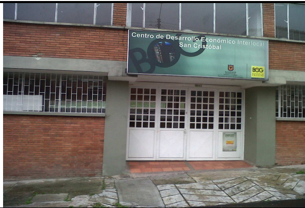
Entrada al centro de información Sociocultural Artístico y de Patrimonio